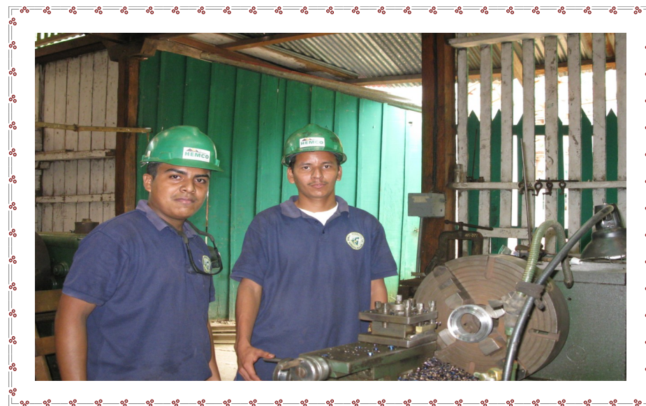
Torneros en pleno cumplimiento de sus funciones

Mina Subterránea Mina Subterránea Taller Industrial Mantenimiento Laboratorio Exploración La Calera Seguridad Física