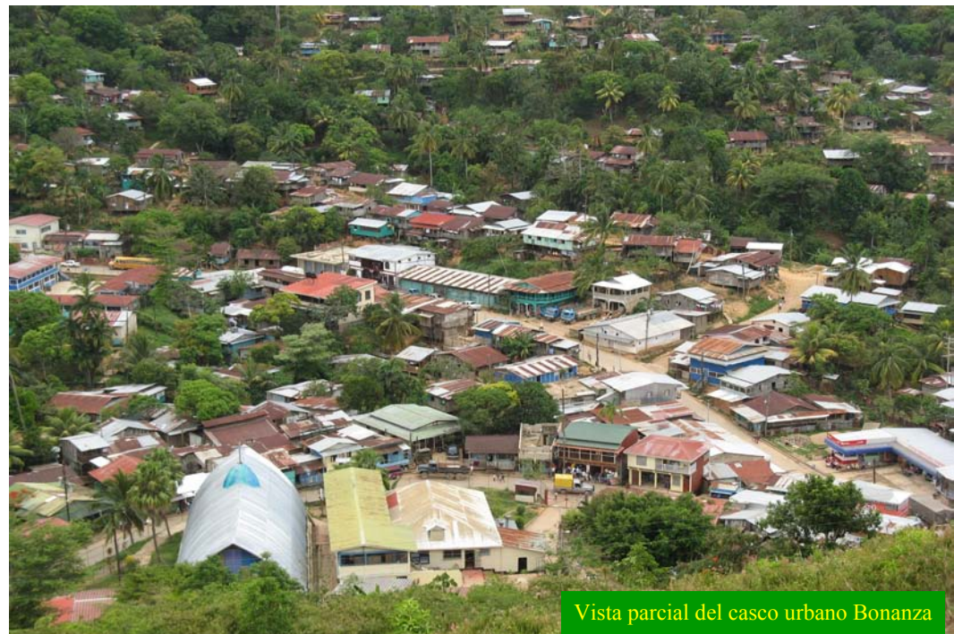
Vista parcial del casco urbano Bonanza